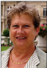
Par Odette Herviaux Sénatrice du Morbihan