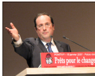
François Hollande s'est vu remettre, lors du meeting de Pontivy, le texte du Projet 2007-2008 de la Fédération : "Bâtir la société de la confiance".

tie sur la méfiance, voire la défiance des Français envers la pratique politique, le projet global "Bâtir une société de la confiance" repose sur la colonne vertébrale du développement durable et solidaire avec plusieurs piliers : - le choix transversal de l'Egalité Hommes-Femmes qui reprend le rapport spécifique publié sur ce sujet ; - le développement d'une économie plurielle (économie de marché, économie des besoins, économie sociale et solidaire) ; - les enjeux agricoles et maritimes (avec l'exemple du Pays de Lorient sur ce point) ;