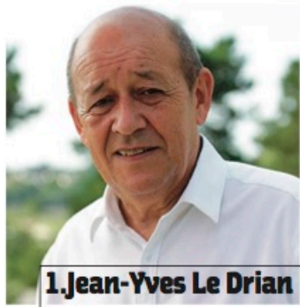
1. Jean-Yves Le Drian